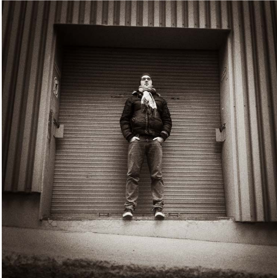
VJ HOMING / www.vjhoming.com / Ghotiitout

Comme Vj, Homing inverse les rôles : son interprétation visuelle d'une histoire sonore se traduit pas des illustrations colorées et urbaines qu'il produit lui-même, reflet de sa sensibilité artistique.